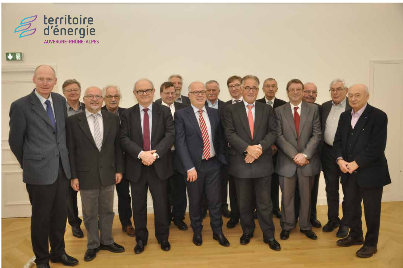
Les présidents et vice-présidents des syndicats d'énergie d'Auvergne Rhône-Alpes